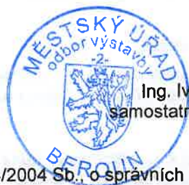
Ing. Ivana Riegerová samostatný odborný referent

Rozhodnutí má podle § 93 odst. 1 stavebního zákona platnost 2 roky. Podmínky rozhodnutí o umístění stavby platí po dobu trvání stavby či zařízení, nedošlo-li z povahy věci k jejich konzumaci.